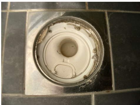
1. ETASJE > BAD - 8,9M2