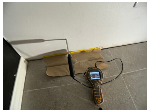
1. ETASJE > VASKEROM - 7.1M2

Relativ luftfuktighet mellom 86,5-100 % anses å være meget fuktig