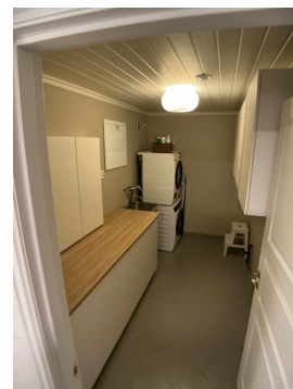
1. ETASJE > VASKEROM - 7.1M2