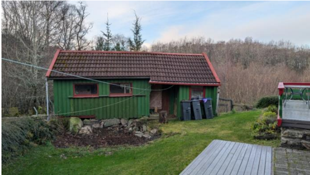
Vesentlige skeivheter. Bygningen er ikke oppmålt eller vurdert.