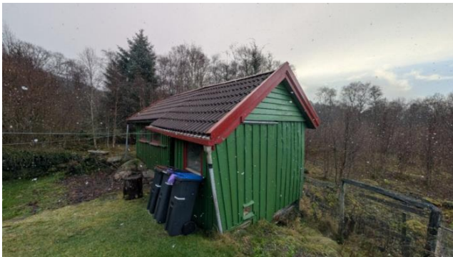
Vesentlige skeivheter. Bygningen er ikke oppmålt eller vurdert.