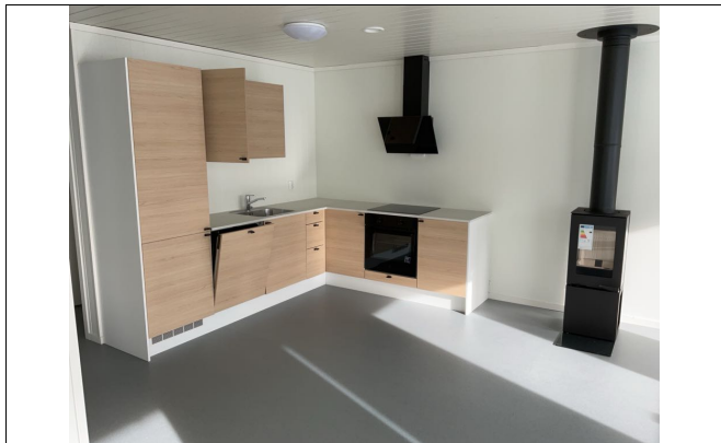
Kjøkken med glatte fronter og laminert benkeplate. Det er ventilator over komfyren