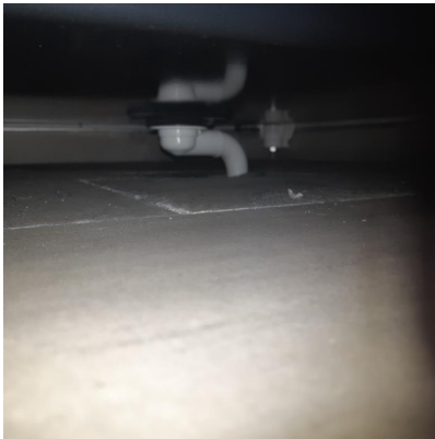
Sluk under dusjkabinett

Smøremembran er klemt under klemring i sluk