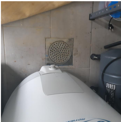
vv-tank og sluk

VV-tank, trykktank og vannpumpe står i boden.