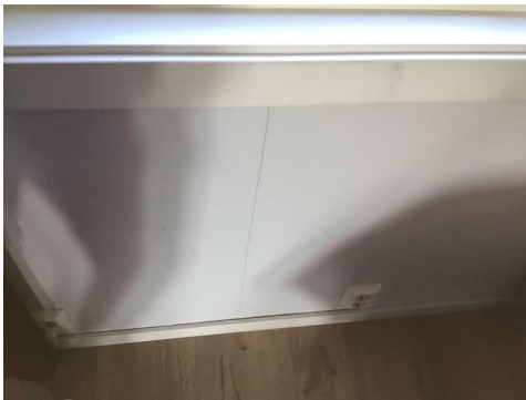
Sprekk på vegg

Normal slitasje. Sprekk på vegg under vindu på soverom v/stue og hull på vegg over ytterdør i entre.