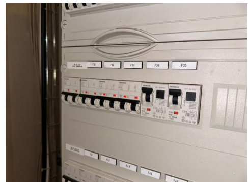
Sikringskapp plassert i felles oppgang.