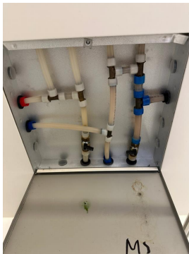
Samleskap med rørkurser og stoppekraner

Røropplegg fremstår med: vanntilkobling med skjulte Pex-rør. Samleskap med rørkurser og stoppekran er plassert i himlinger på bad. Stoppekraner er testet og fungerer som de skal.