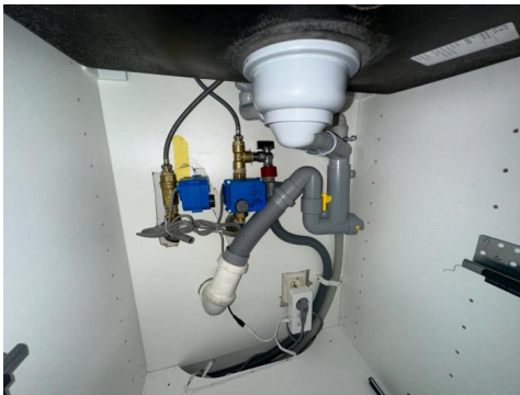
Røropplegg i kjøkkenbenk med Waterguard