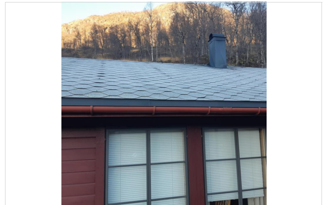
Shingeltak. Noen plater har synlige skruer med pakning.