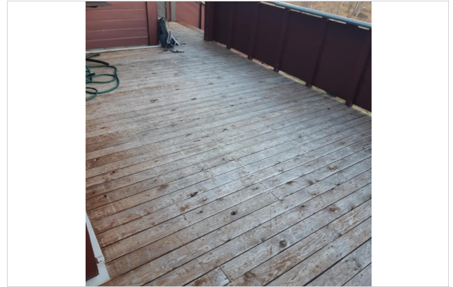
Terrasebord har en del slitasje.