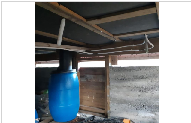
Toalett med "Jelsatønne"