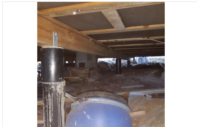
Bjelkelag med stubbloftsplater