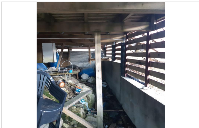
Innstøpte peler i ringmur