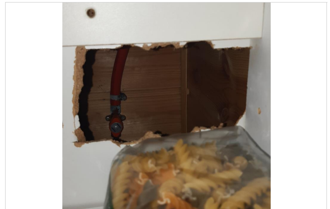
Gasslange til kjøleskap