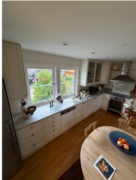
2. ETASJE > KJØKKEN - 14.8M2