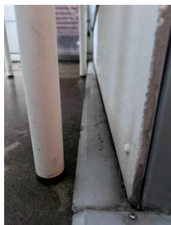
Manglende fall ut på beslaget mellom vegg og balkongdekke