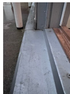
Manglende fall ut på beslaget under balkongdøren