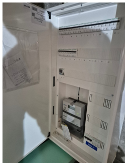
Sikringskap i kjeller.