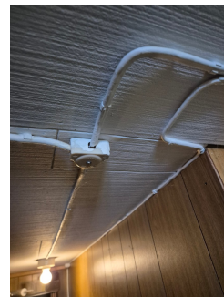
Eldre anlegg i kjeller.