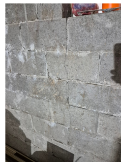
Sprekk i grunnmur.