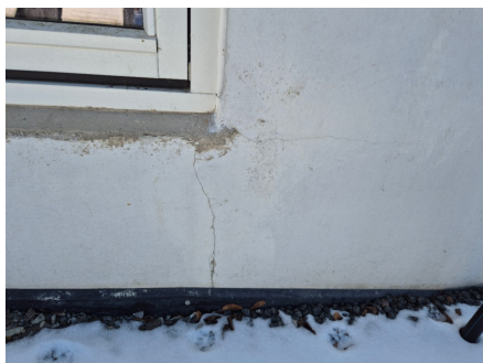
Riss i grunnmur.

Sprekker er stedvis utbedret av eier. Synlige sprekker bør tettes, og tilstanden bør overvåkes over tid.