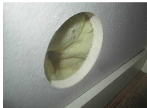
Hulltaking er foretatt i fra gangen mot dusjhjørne.

Hulltaking er foretatt i fra gangen mot dusjhjørne, uten å påvise unormale forhold. Måleresultat: Under 8 vektprosent.