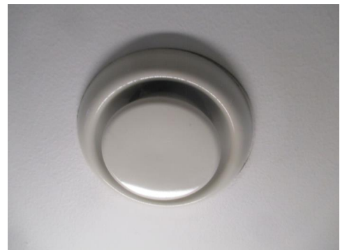
Avtrekk i himling.