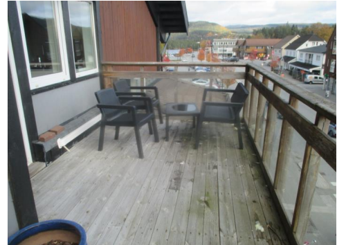
Deler av terrassen.

En større terrasse ut i fra stue med glassrekkverk og en skillevegg. Vanlig normalt vedlikehold må beregnes på terrasse med tilhørende deler.