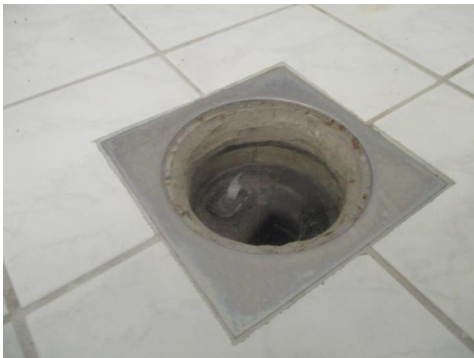
Sluk utenfor dusjhjørne.

Kostnadsestimat: Ingen umiddelbar kostnad