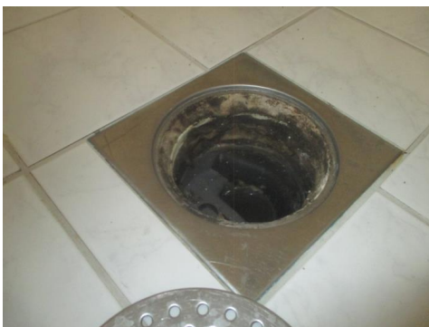
Sluk i dusjhjørne.