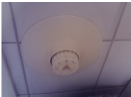
Regulering av gulvvarme.