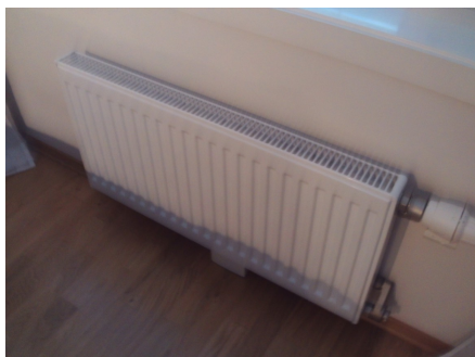
Radiator på soverom.

Er lagt opp vannbåren varme i gulvet på bad/vaskerom og radiatorer på soverom og stue.