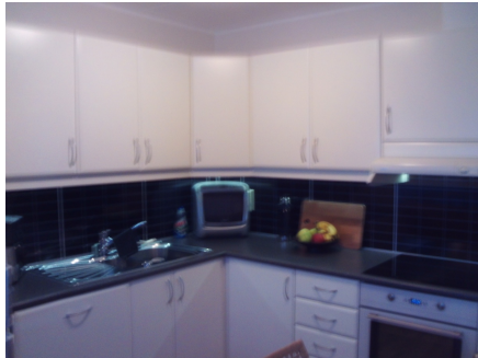
Deler av innredningen.