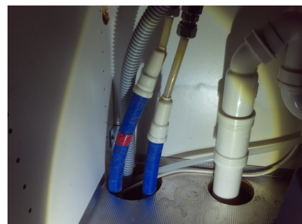
Rørøplegg i kjøkkenbenken.