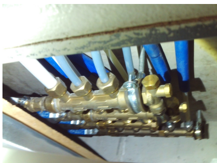
Fordelinger i himling.