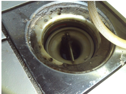
Sluk under dusjkabinett.