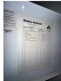
Kursoversikt i sikringskap