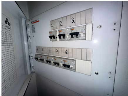
Sikringskap med automatsikringer.

TG2 settes i følge forskrift på anlegg, uten fremlagt samsvarserklæring/ dokumentasjon på hele anlegget.