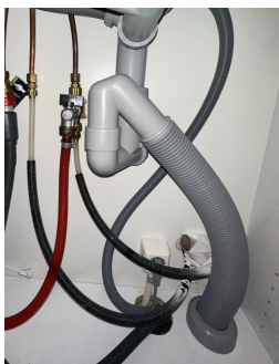
Røropplegg i kjøkkenbenk

Det anbefales å montere Waterguard/ lekkasjestopper på vanninstallasjoner i rom uten sluk. Om lekkasjer oppstår vil dette kunne forårsake større skader.