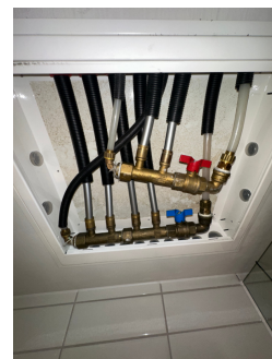
Samleskap med rørkurser og stoppekraner