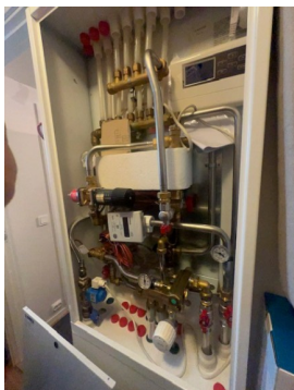
Fordelerskap for vannvarme.

Leilighet i bygning er tilknyttet sentralvarme anlegg som forsyner leilighet med varmt forbruksvann og oppvarming.