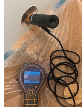
Fuktmåling i vegg mot våtsone

Hulltaking er foretatt uten å påvise unormale forhold. Hulltaking er foretatt ved/i Wc. Fuktkvotemåling (vekt%) i konstruksjonen ble målt til 0.