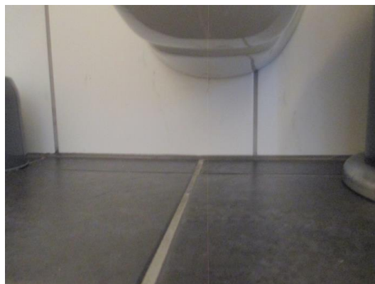
Ingen hull for synliggjøring av lekkasjevann.