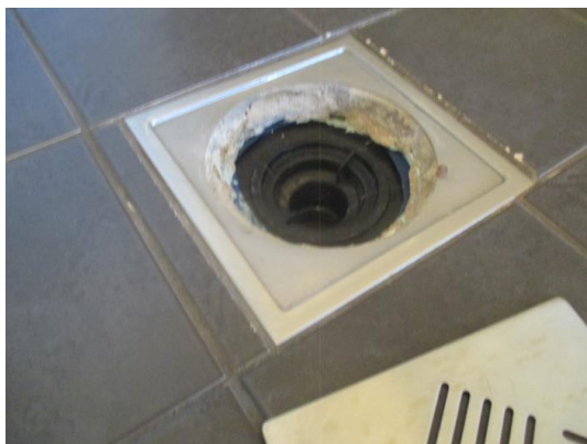
Sluk i dusjhjørne.

Smøremembran med ukjent utførelse og en sluk i dusjhjørne.