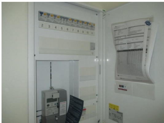
Sikringskapet er plassert i gangen av leiligheten.