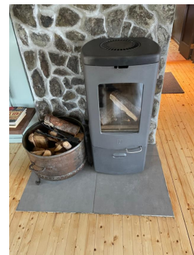
Peisovn i stue