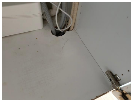
Svelleskade på bunnplate.