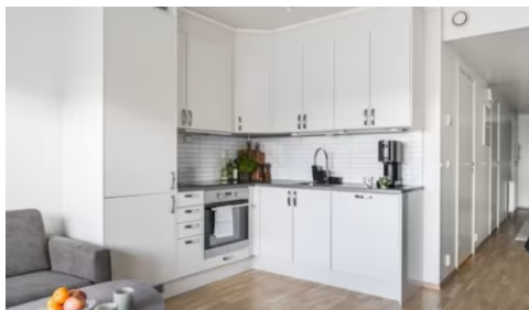
Bilde viser kjøkken.