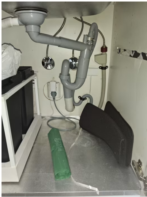
Bilde viser røropplegg under oppvaskkum på kjøkken.