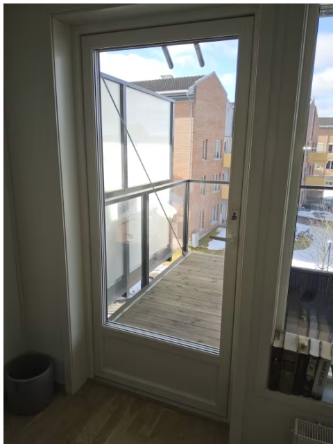
Bilde viser balkongdør.