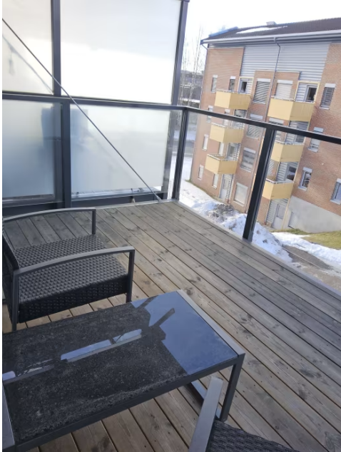
Bilde viser balkong.