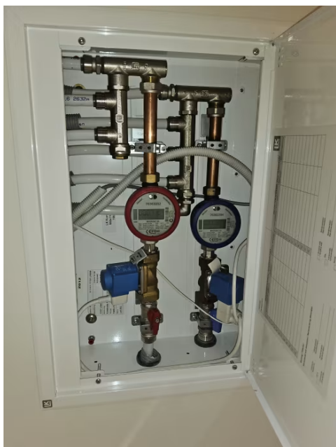
Bilde viser fordelerskap for rør i rørsystem.