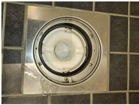
Bilde viser sluk på bad.