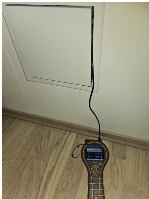
Bilde viser fuktmåling i inspeksjonsluke.