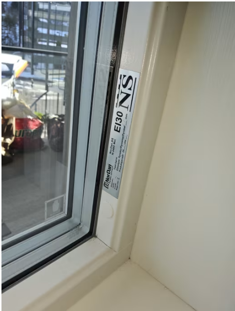
Bilde viser brannklassifisert vindu på soverom.