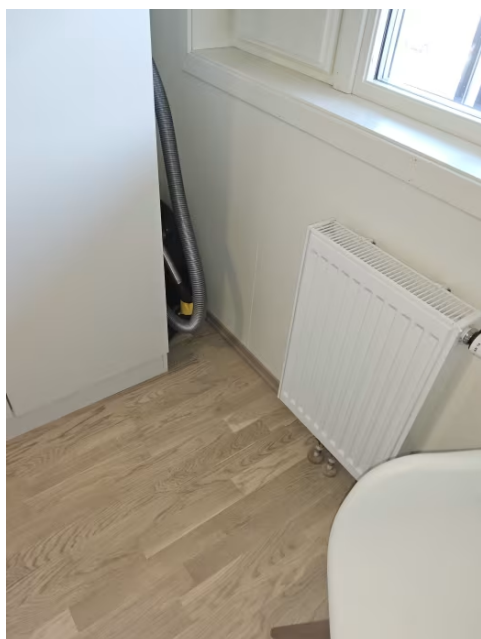
Bilde viser radiator på soverom.