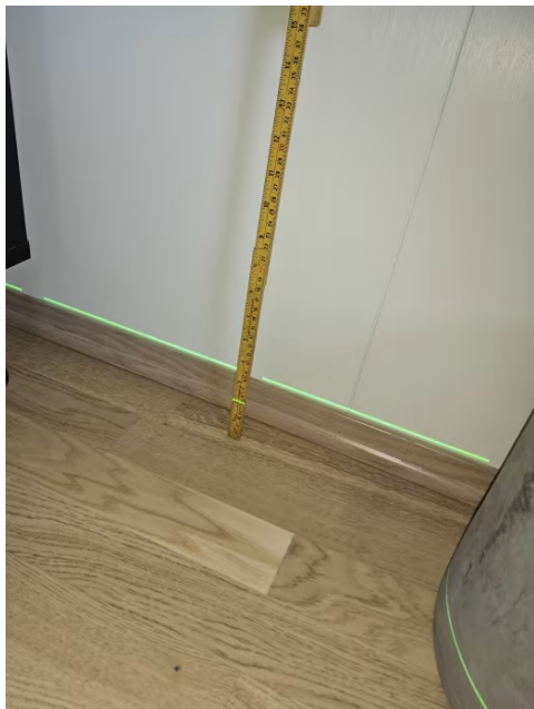
Bilde viser måling av etasjeskiller.