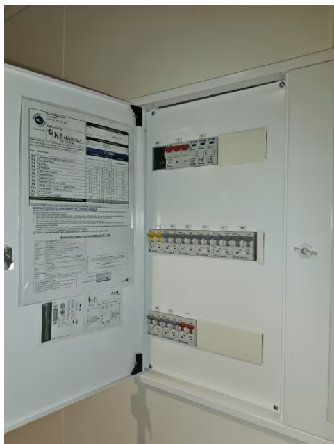
Bilde viser sikringssskap.