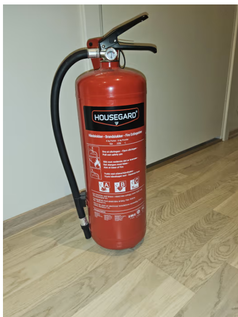
Bilde viser brannslukningsapparat.

Er det manglende samsvar mellom dagens bruk og godkjente byggetegninger?