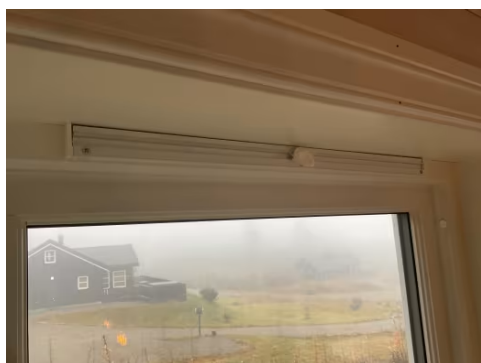
Ventiler i vindu.