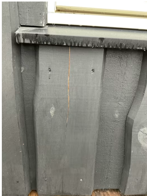
Sprekk i kledning.