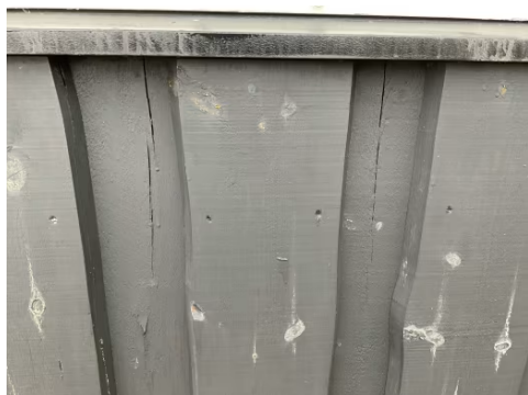
Sprekk i kledning.