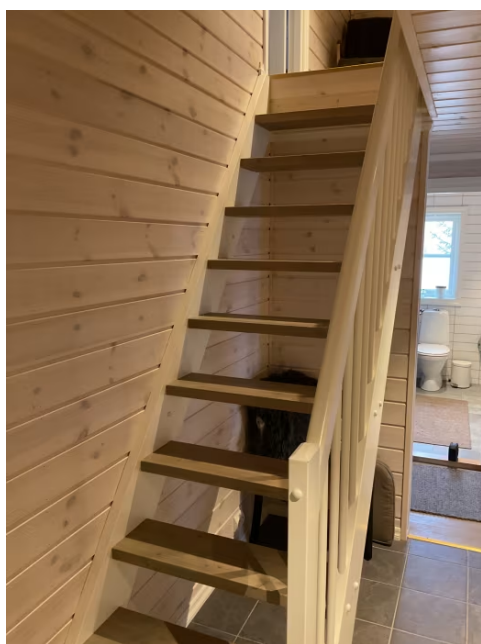
Trapp opp til hems.