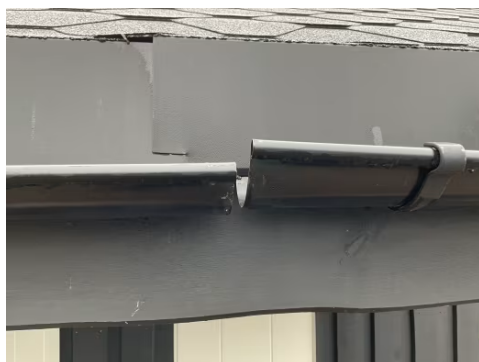
Manglende skjõt i takrenne.