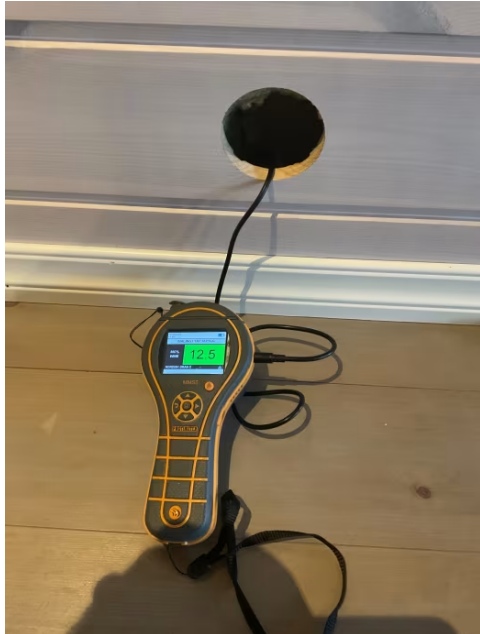
Hulltaking i tilstøtende rom.