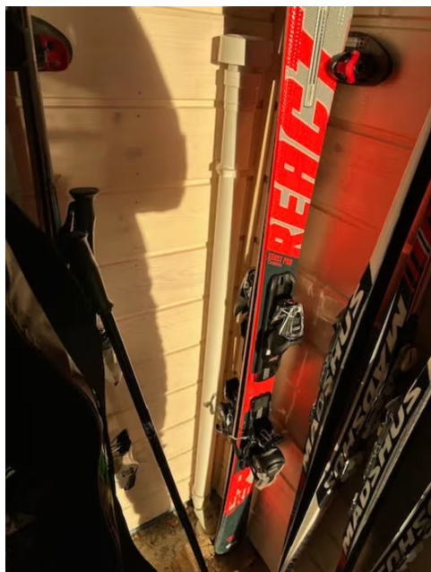
Lufting av kloakk.