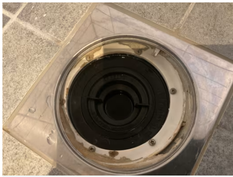
Manglende membran under klemring.