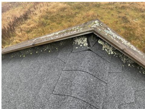
Mose på tak.