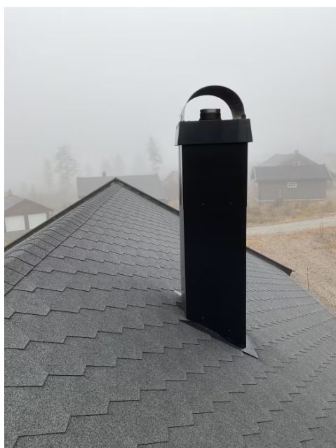
Pipe over tak.