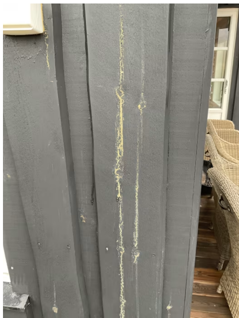
Utslag av kvae.