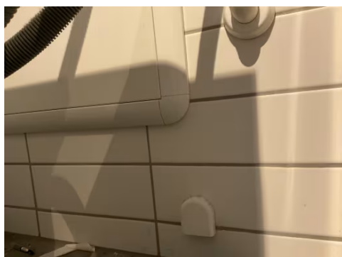
Avrenning for fordelerskap.