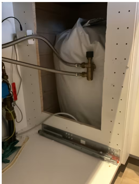
Bereder plassert under benk på kjøkken.