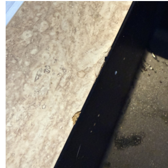
Skade i benkeplate