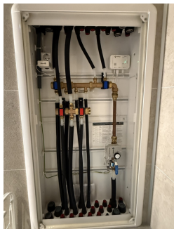
Stoppekran og fordelerskap