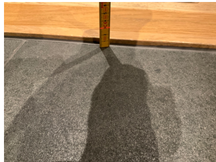
Hulrom registrert ved døren