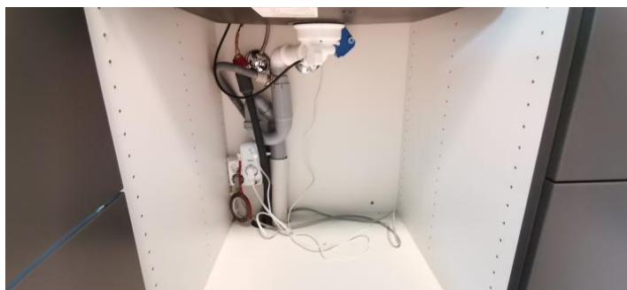
Kontroll av røropplegg under oppvaskkummen.

Kjøkkeninnredning av merke DrømmeKjøkken og hvitevarer av merket AEG.