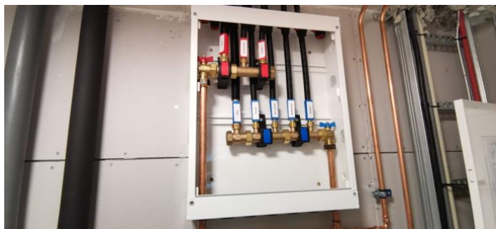
Kontroll av fordelskapet.

Leiligheten har vannrør av kobber og plast (rør i rør), fordelskap plassert i felles teknisk rom.