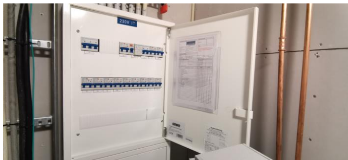
Kontroll av el-skapet.