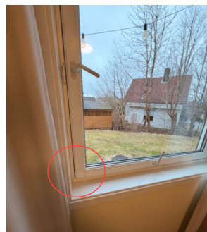
Vindu tar i karm