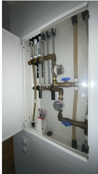
Besiktigelse av røropplegg.