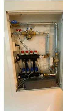
Besiktigelse av røropplegg.

Vannbåren varme i gulvet fra byggeår. Grunnet skjult i konstruksjonen er røropplegg i hovedsak vurdert opp mot alder og normal forventet levetid.