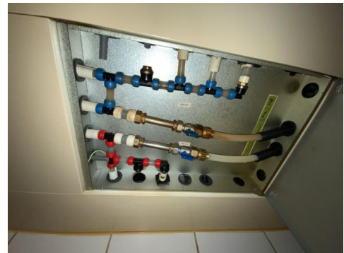
Besiktigelse av røropplegg.