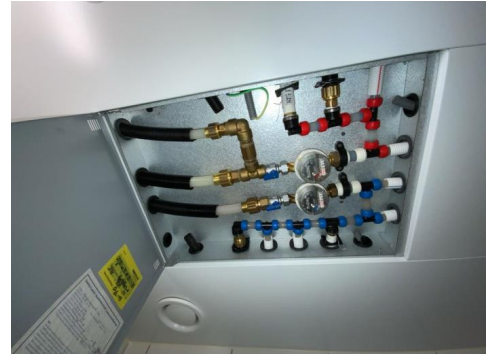
Besiktigelse av røropplegg.