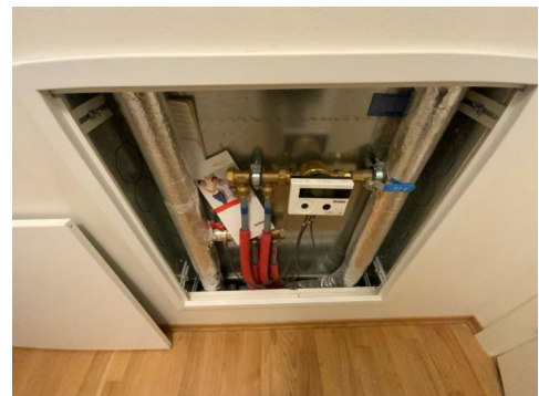
Besiktigelse av røropplegg.