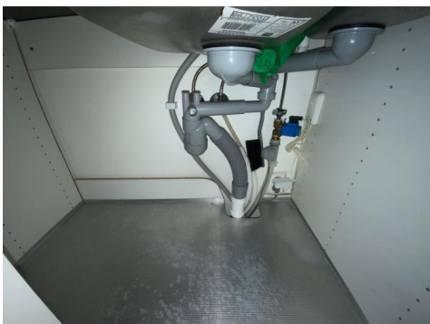
Besiktigelse av røropplegg.

Vannrør fra byggeår av materialtype pex og kobber. Fordelerskap. Waterguard i benkeskap på kjøkken for god sikring av lekkasjevann. Alder er normalt i seg selv en vurderingskriterie hva angår slitasjegrad. Hovednettet er som oftest selskapets ansvar. Dette er ikke undersøkt. Videre bemerkes at bunnledninger av den årsak følgelig heller ikke er kontrollert. Ingen negative avvik observert på befaringdagen.