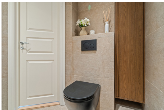
KRYPKJELLER > BAD/VASKEROM - 4.1M2