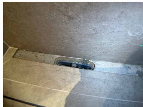
KRYPKJELLER > BAD/VASKEROM - 4.1M2