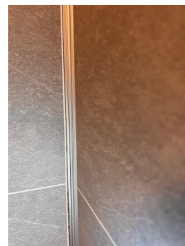
Plate er ikke montert inn i profil til innvendig hjørne og er utett i dusjsoner.

Rommet fungerer med dagens innredning, men endres bruken til nedslag direkte på guvfliser, må det regnes med oppgradering av vegger til og tåle bruksvann som belastes vegger ved bruk av dusj.