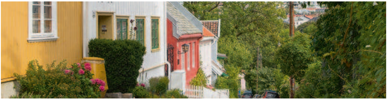
Forts. Viktige endringer i avhendingsloven

Opplysningene i tilstandsrapporten skal gis på en forbrukervennlig måte, og det er beskrevet hva takstmannen skal vurdere og hvordan noen av undersøkelsene skal gjennomføres.