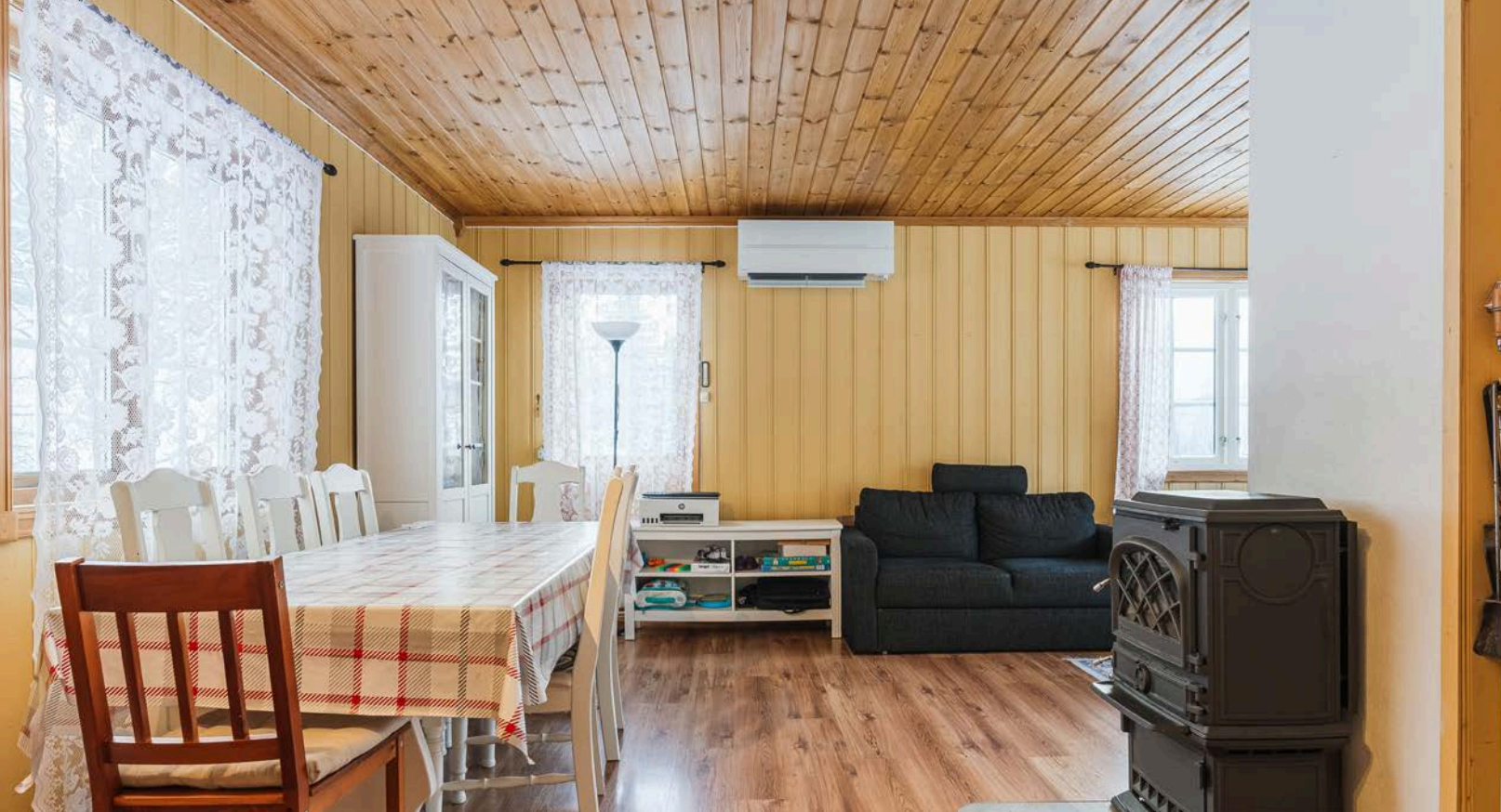
I stuen står det en peisovn med glassdør, og det er en nyere varmepumpe opplyst montert i 2019.