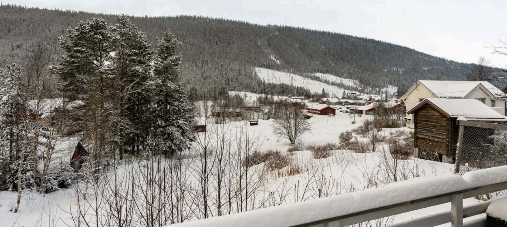
Utsikten mot selve sentrum som ligger i retning vest, sett fra terrassen.