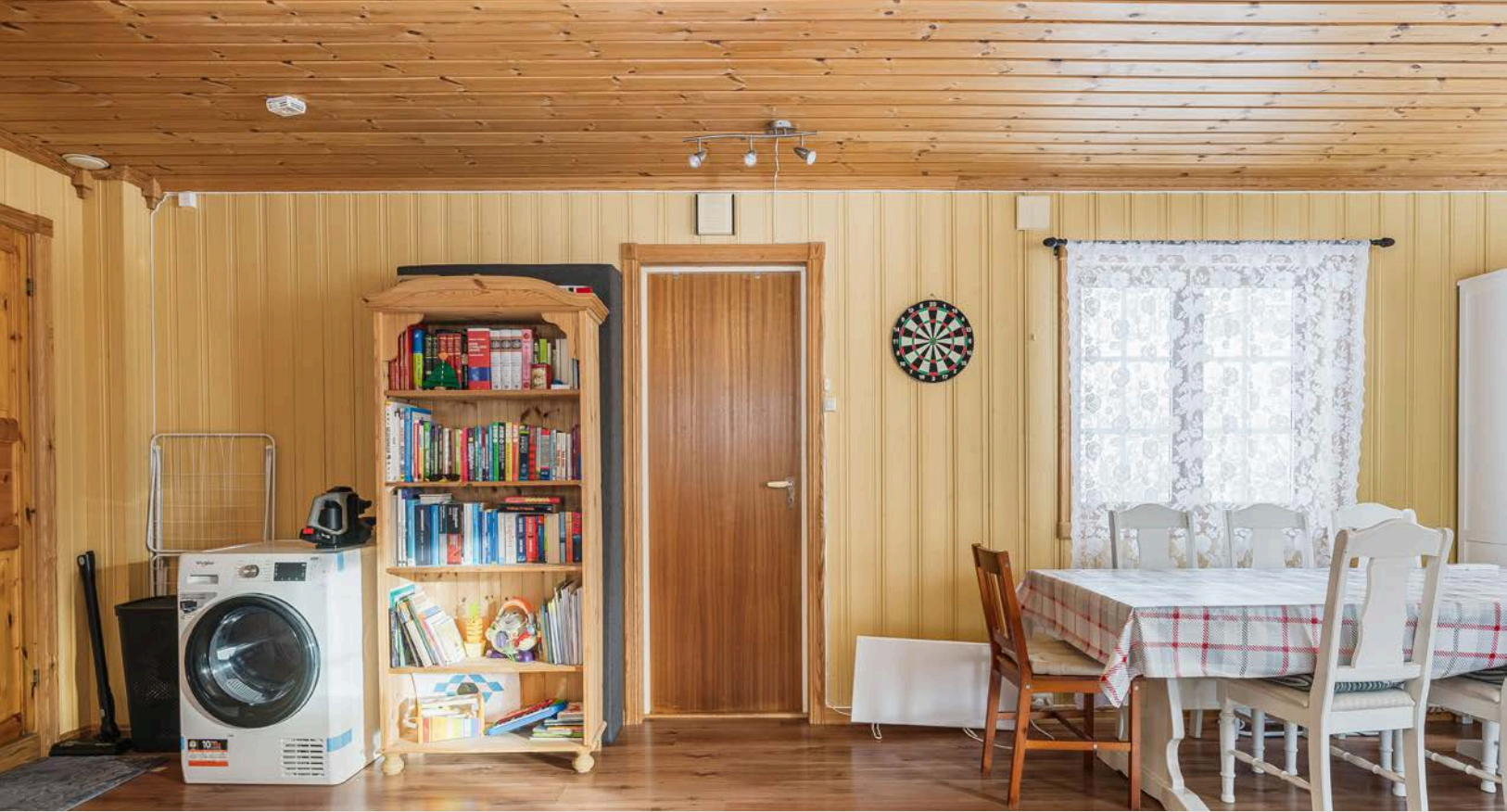
Gangen fører inn til stuerommet i vinkel som ligger med åpen løsning til kjøkkenet.