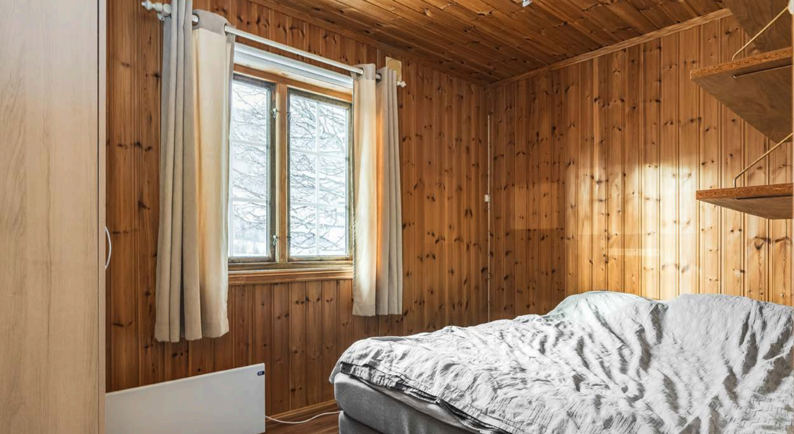
Hovedsoverommet som ligger vendt mot vest, har plass til dobbeltseng og er innredet med garderobereskap.