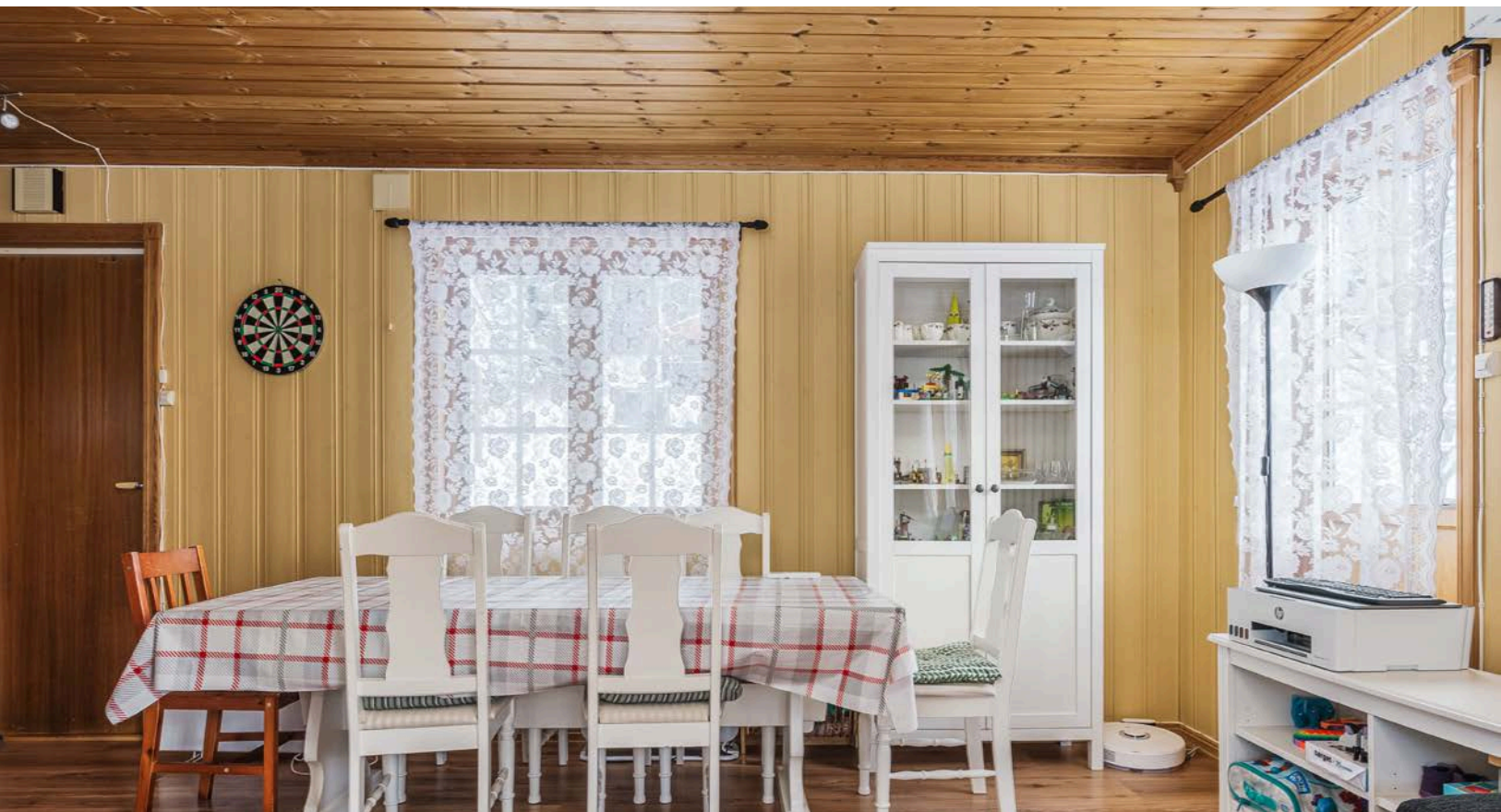
Det er god plass til både sittegruppe og spisegruppe i stuen.