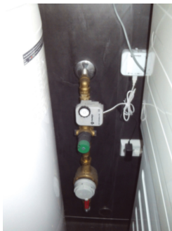
Innvendig stoppekran med vannmåler.