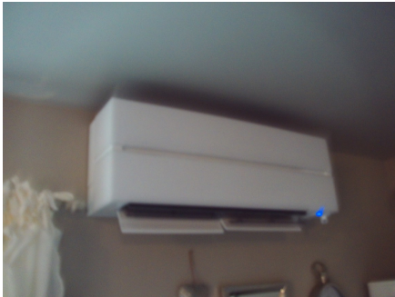
Varmepumpe i stue.