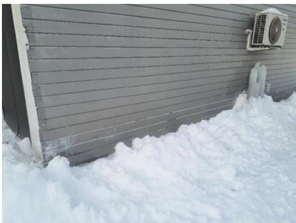
Sikret med netting