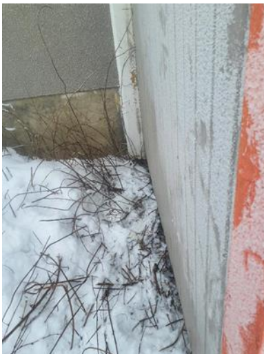
Bakside montert netting