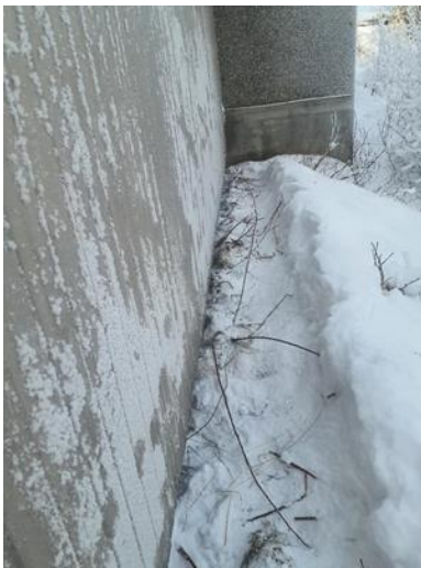
Bakside montert netting