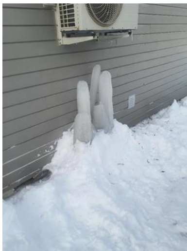
Var en del is under varmepumpe, skal fjerne å sikre bak der 25.feb.