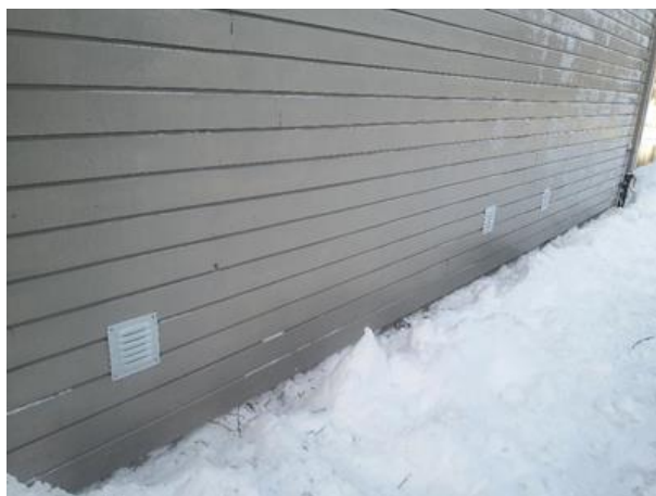
Kappet rør og montert netting/ventil