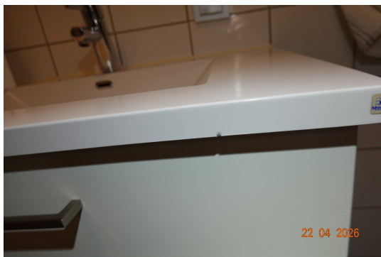
LEILIGHETEN I 2. ETASJE > BAD/VASKEROM