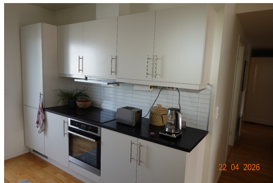
LEILIGHETEN I 2. ETASJE > STUE/KJØKKEN/SPISESTUE