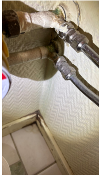
Drypper fra rørskjøt.