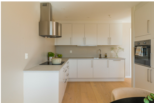
3.ETASJE > STUE/KJØKKEN - 34.4M2

Sigdal Kjøkken innredning med glatte fronter. Benkeplaten er av laminat. Det er kjølfryseskap, oppvaskmaskin, platetopp, stekeovn, vannstoppsystem og komfyrvakt.