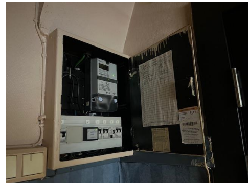
Sikringskap plassert i entre.

I følge DIBK (direktoratet for byggkvalitet) er det ikke den bygningssakkyndige sitt ansvar å gjennomføre kontroll av det elektriske anlegget. Elektriske installasjoner er i dag strengt regulert med tekniske krav til installasjonene og kompetansekrav til de som skal utføre arbeidet. Det er bare fagfolk som har de nødvendige kvalifikasjonene etter forskrift om elektroforetak og kvalifikasjonskrav for arbeid knyttet til elektriske anlegg og elektrisk utstyr, som kan utføre el-kontroll.