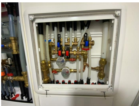
Besiktigelse av røropplegg.

Vannrør fra byggeår av materialtype pex og kobber. Fordelerskap i entré. Waterguard i benkeskap på kjøkken for god sikring av lekkasjevann. Alder er normalt i seg selv en vurderingskriterie hva angår slitasjegrad. Hovednettet er som oftest selskapets ansvar. Dette er ikke undersøkt. Videre bemerkes at bunnledninger av den årsak følgelig heller ikke er kontrollert. Ingen negative avvik observert på befaringsdagen.