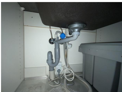
Besiktigelse av røropplegg.