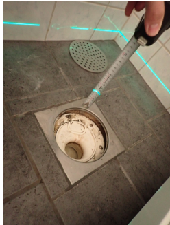
Bilde av sluk.