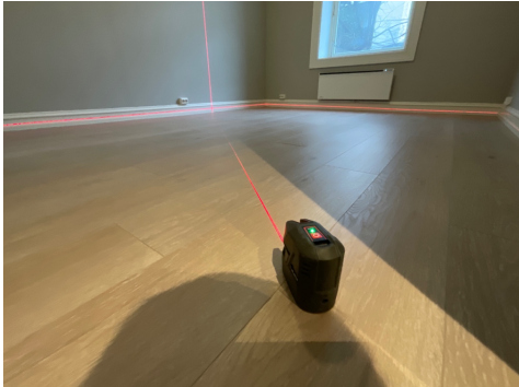
Nivellering soverom, avvik ca. 15-30 mm