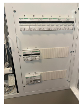
Sikringsskap med automatsikringer.