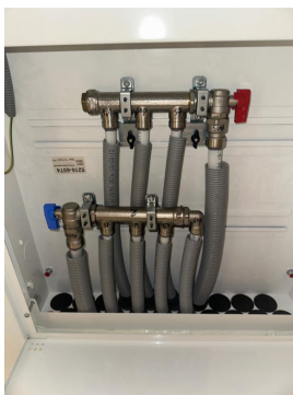
Samleskap med rørkurser og stoppekraner