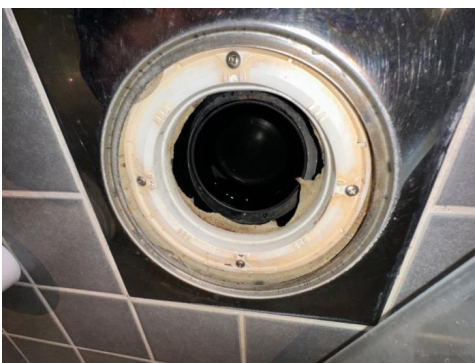
Plastsluk med klemring for membran

Badet er av type badekabin, med eget membran system utarbeidet av produsent. sluket er av plast med klemring for membran. Det er ikke fremlagt noe form for dokumentasjon, badet er merket sertifisert i samleskap. Godkjent sertifisering legges til grunn for oppbygging av tettesjikt.