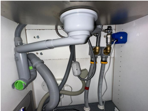
Røropplegg i kjøkkenbenk med Waterguard

Røropplegg i boligen fremstår med: vanntilkobling med Pex-rør, samleskap med rørkurser og hovedstoppekran er plassert på bad. Stoppekraner er testet og fungerer som de skal. Det er montert Waterguard i benkeskap på kjøkken.