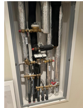
Samleskap for varmeanlegg

Varmeinstallasjoner er ikke funksjon testet på befaring, men antas og fungerer normalt. Det er ikke opplyst om noe feil eller mangler fra eier.