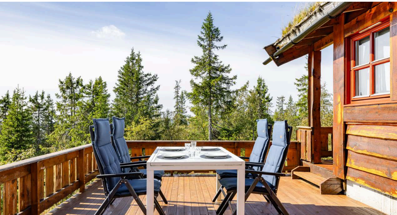
Terrassen er utvidet med en stor og åpen terrasse mot syd.