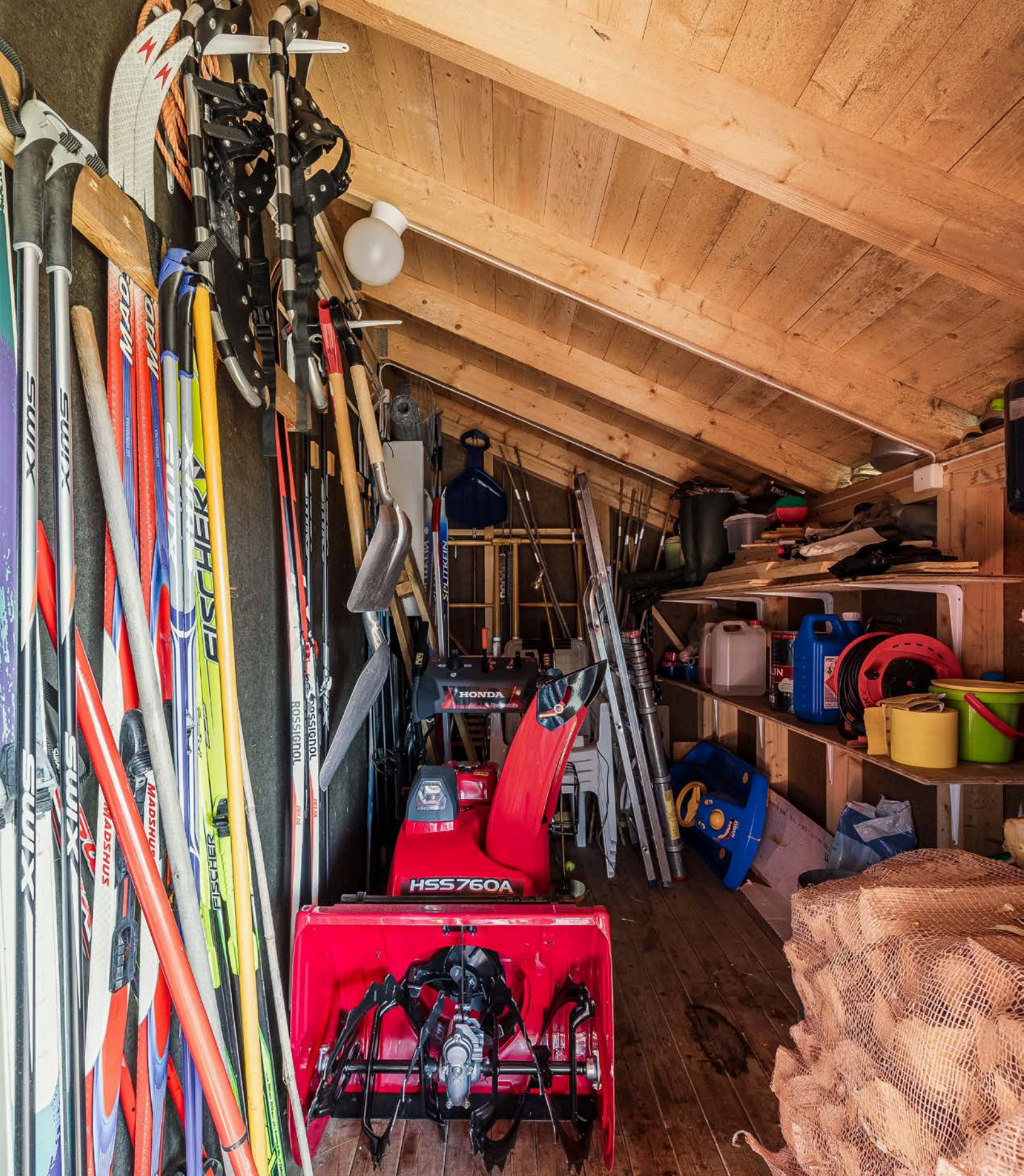
Adkomst til utvendig bod på 5m 2 ved inngangspartiet.