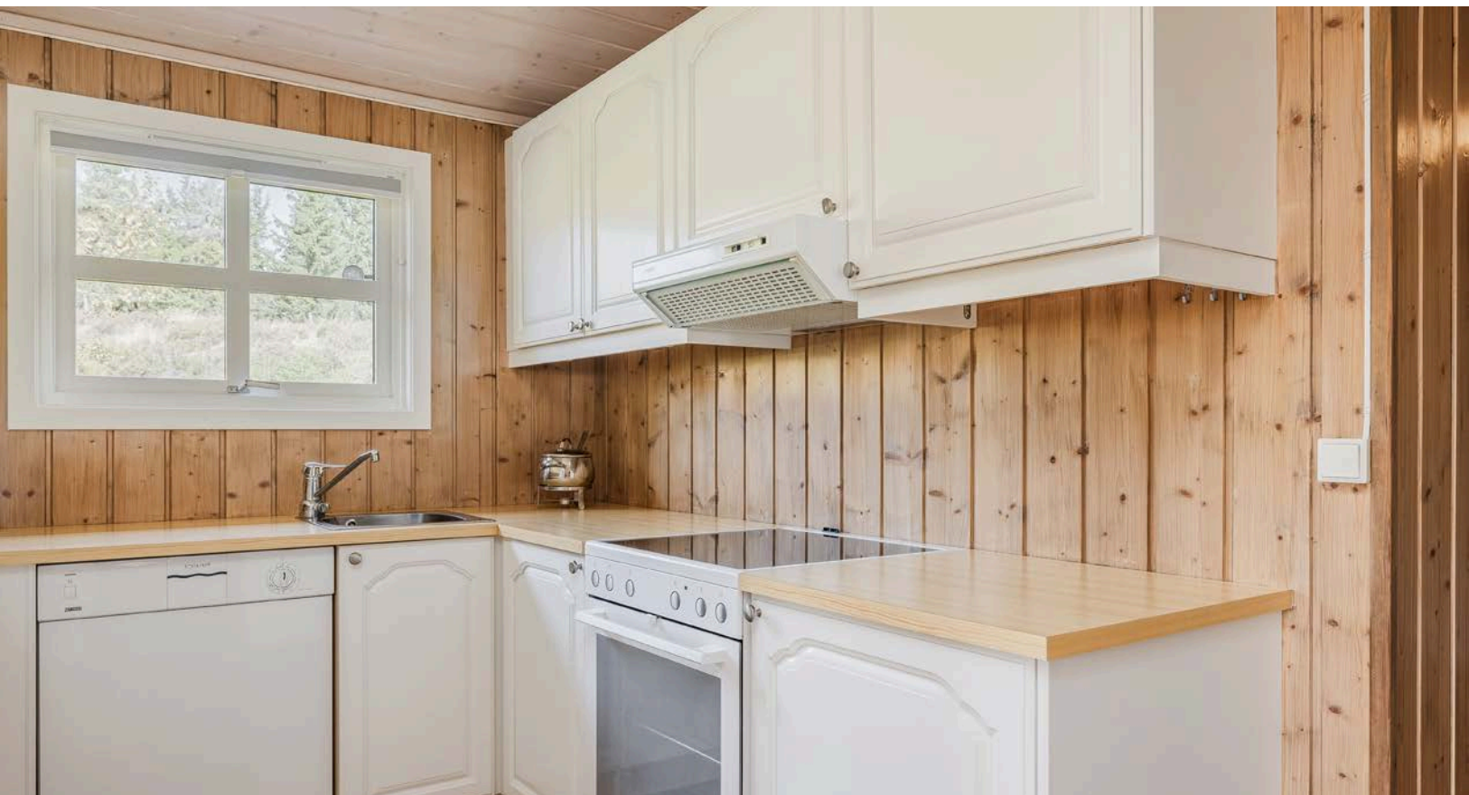
Innredningen har lyse profilerte fronter og laminert benkeplate med nedfelt oppvaskkum. Det er innlagt offentlig vann og avløp.