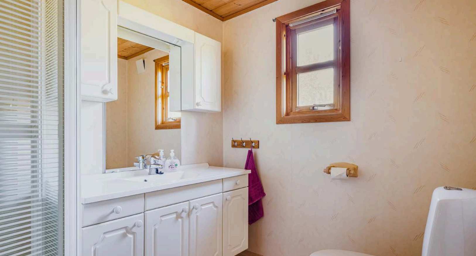
Tidløs baderomsinnredning med lyse fronter og heldekkende servant, speil med belysning og vegghengte skap over.