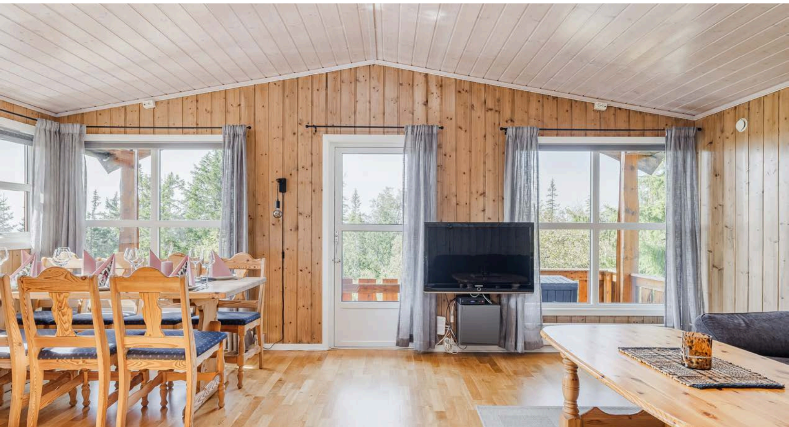
Det er mønet himling som sammen med det gode lysinnsippet gir en luftig romfølelse.