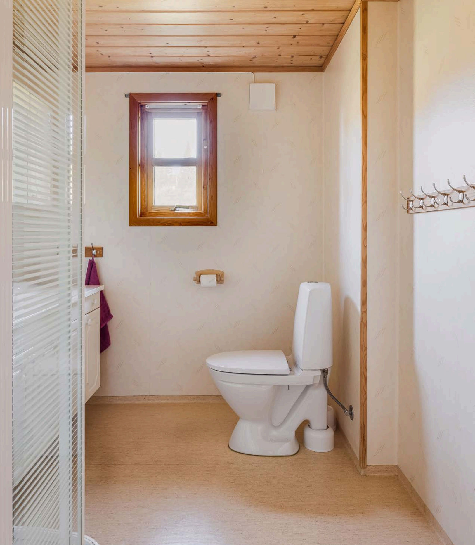
Hytta har et lyst baderom fra byggeåret 2000. Badetrommet har våtromsbelegg på gulv og vegger, samt varmekabler i gulv.