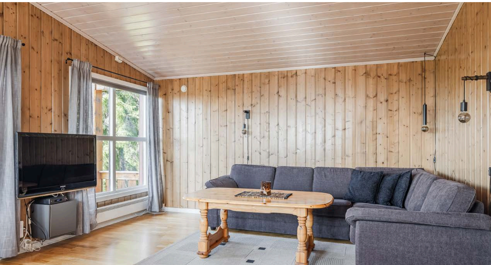
Stuen er romslig med plass til sofagruppe med salongbord, et stort spisebord og annet ønskelig møblement.