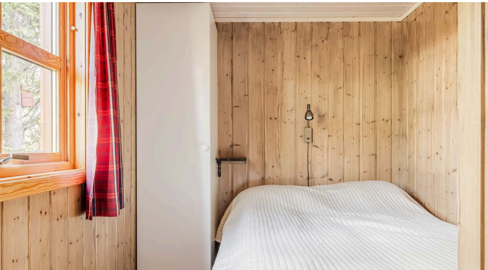
Soverommet er i dag innredet med en dobbeltseng og det er oppbevaringsplass i medfølgende garderobeskap.