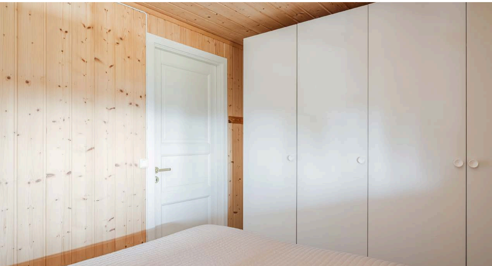
På soverommet er det også god oppbevaringsplass i flere garderober som medfølger i handelen.