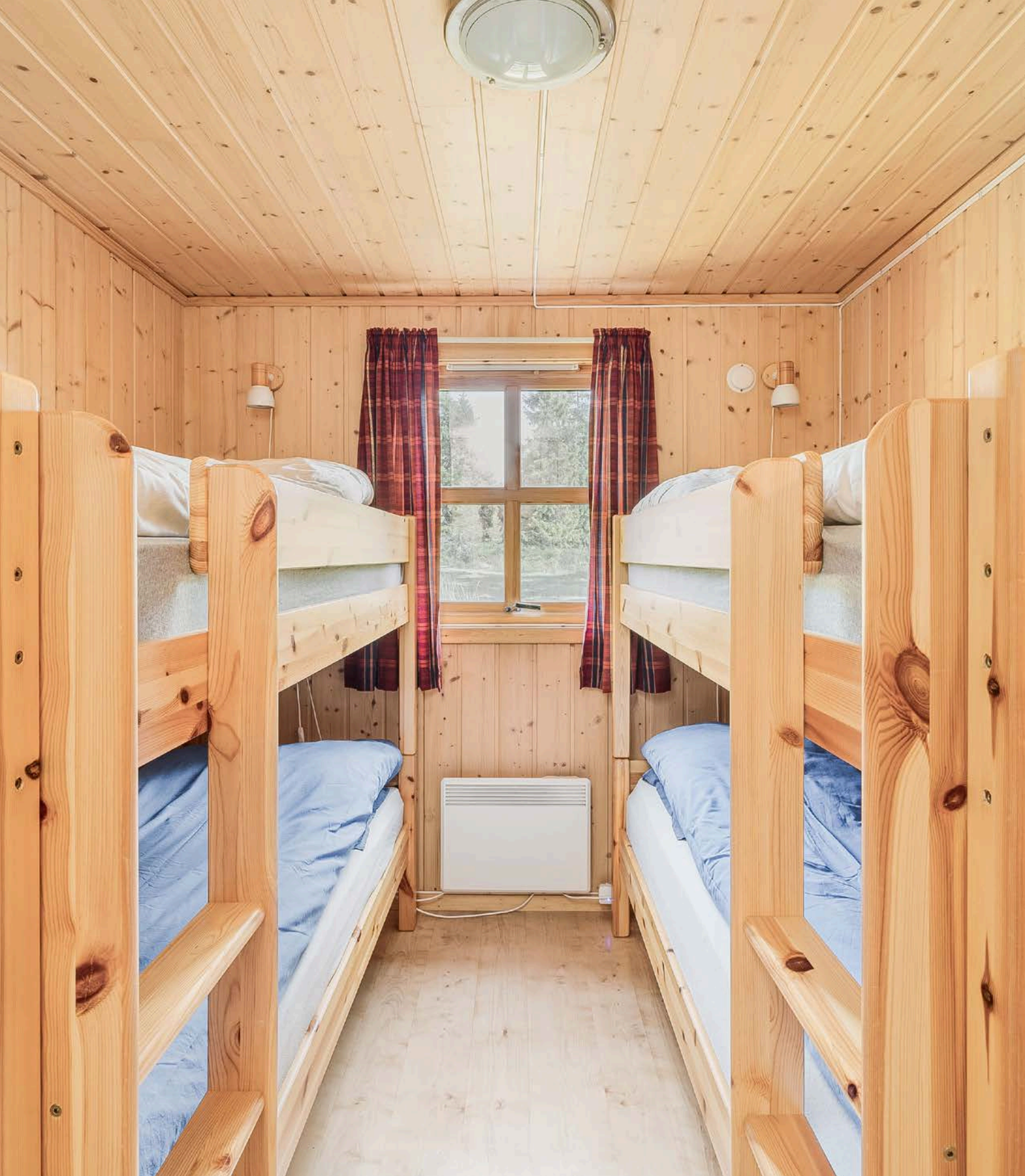
Soverom 3 er i dag innredet med to køyesenger og 4 sengeplasser.