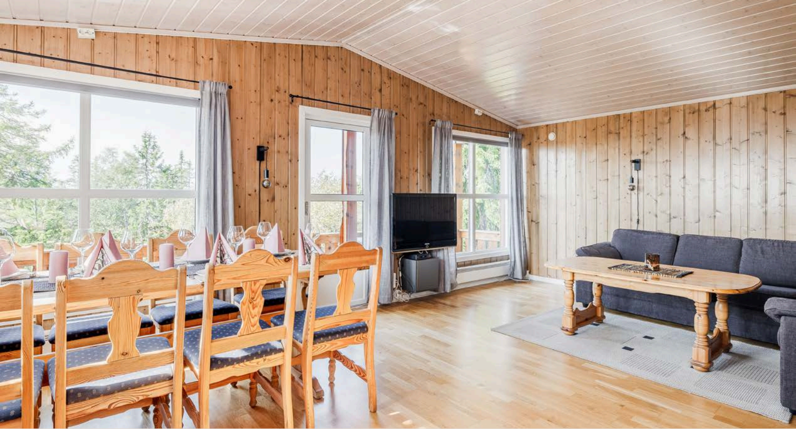
Stuen har god standard med parkett på gulv og overflater med panel.