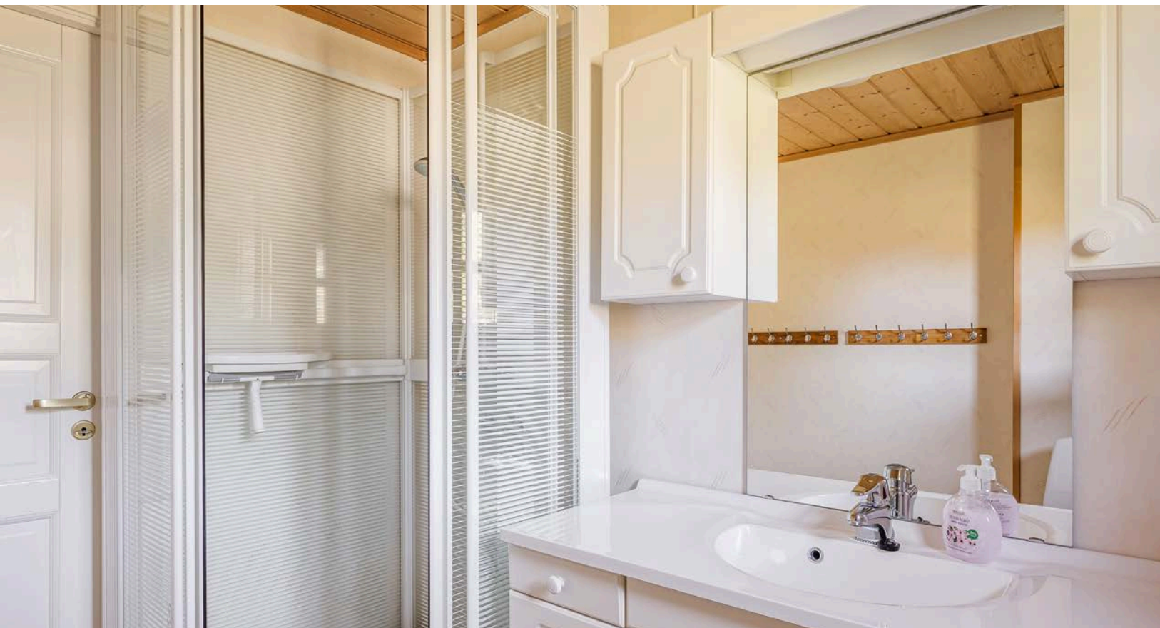
Baderommet er også utstyrt med dusjkabinett og gulvstående toalett.