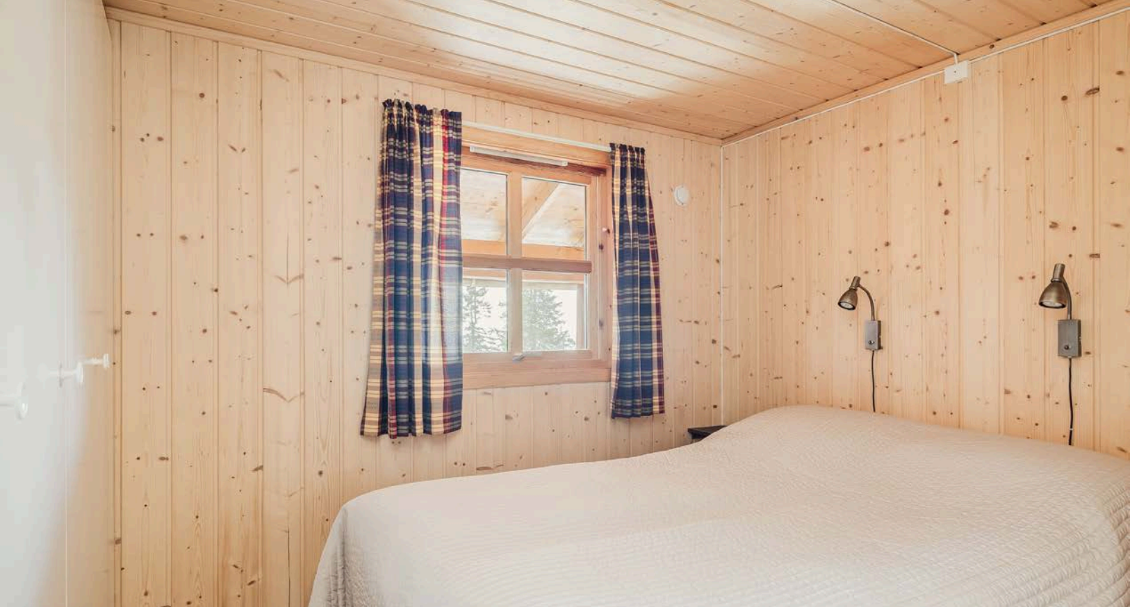
Soverom 1 er i dag innredet som et hovedsoverom med dobbeltseng.