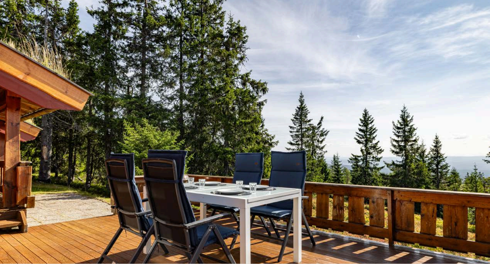
Beliggenheten i høyden og mot syd sørger for gode solforhold og flott utsikt!