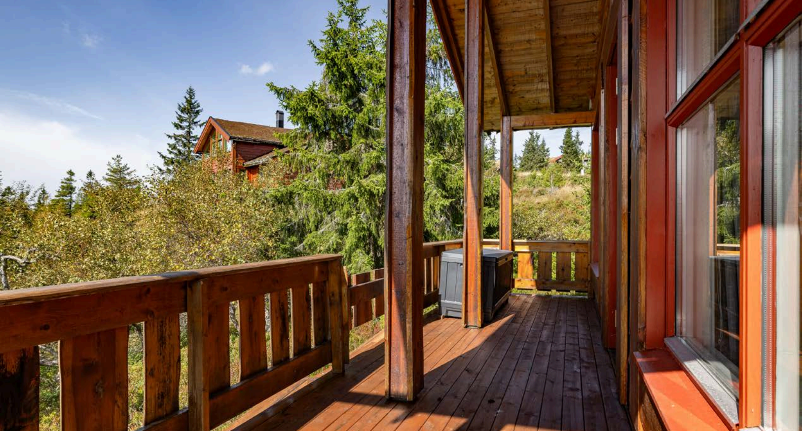
Fra stuen har du utgang til en overbygget terrasse mot vest.