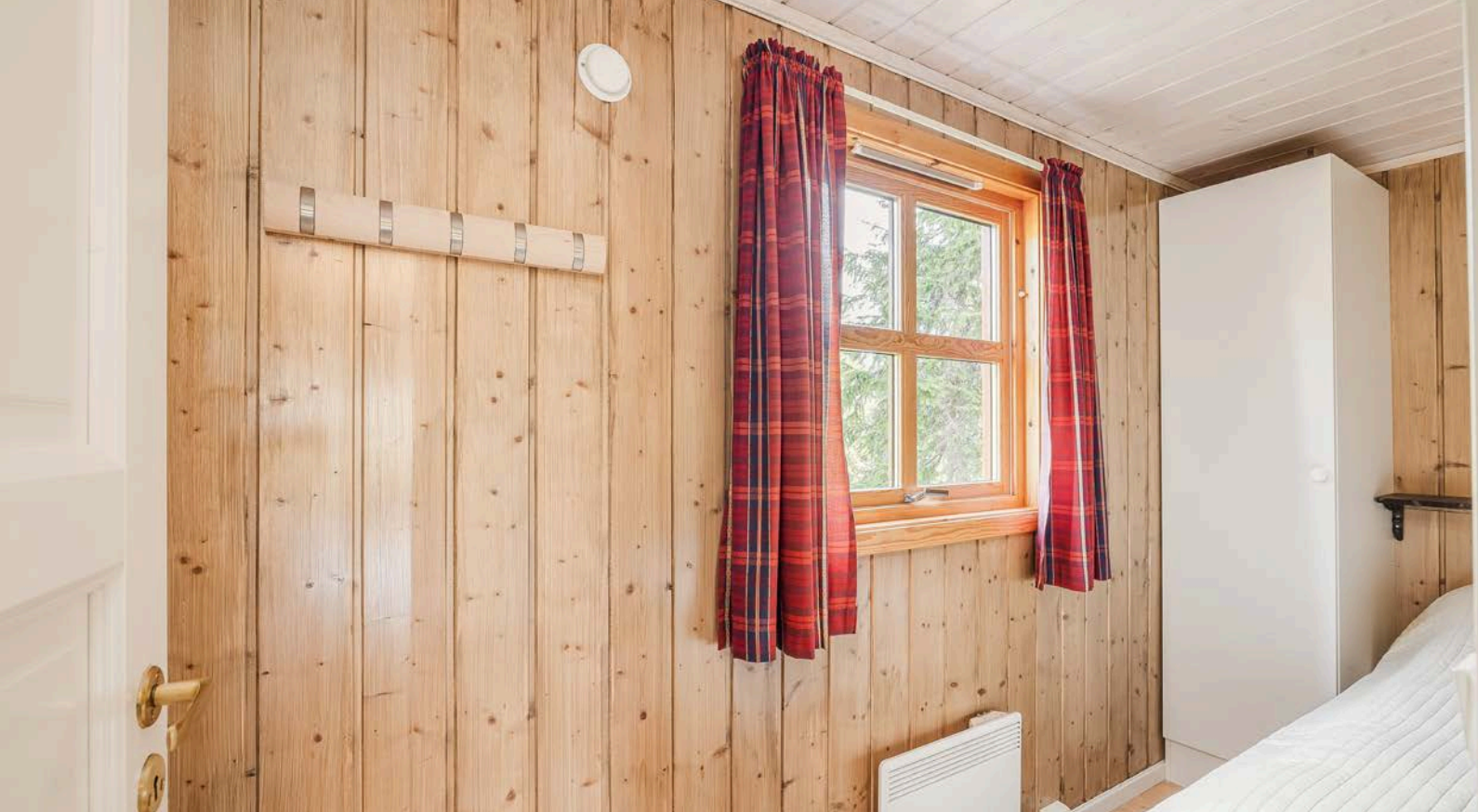
Soverom 2 er et koselig rom med belegg på gulv og panel på veggene.