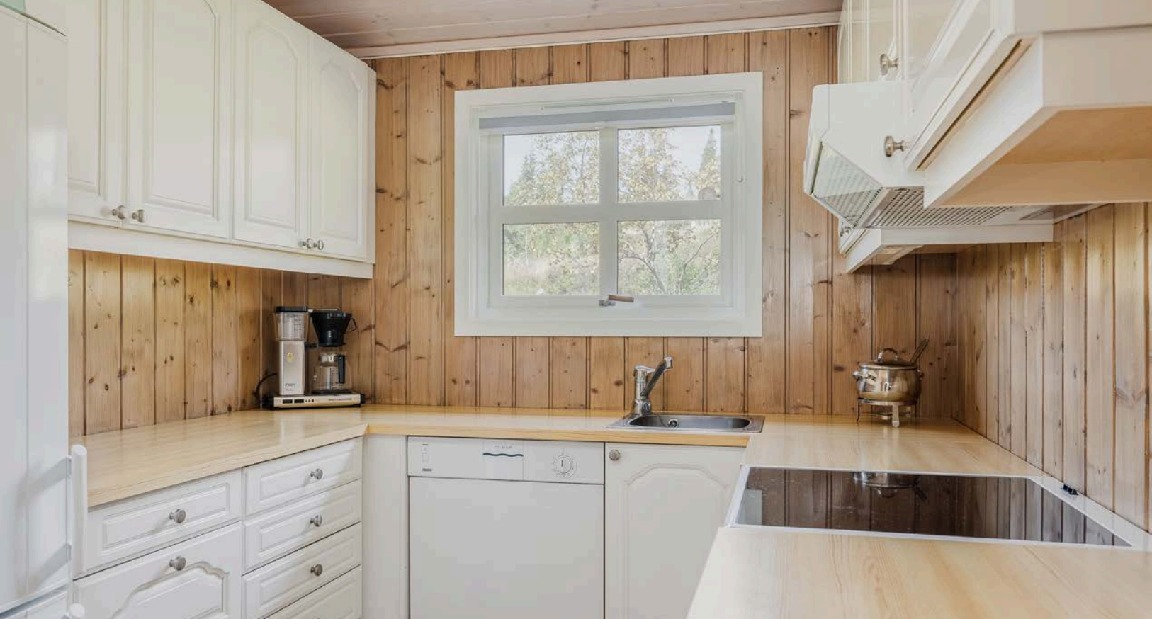
Lys og tidløs kjøkkeninnredning med god skap- og benkeplass.