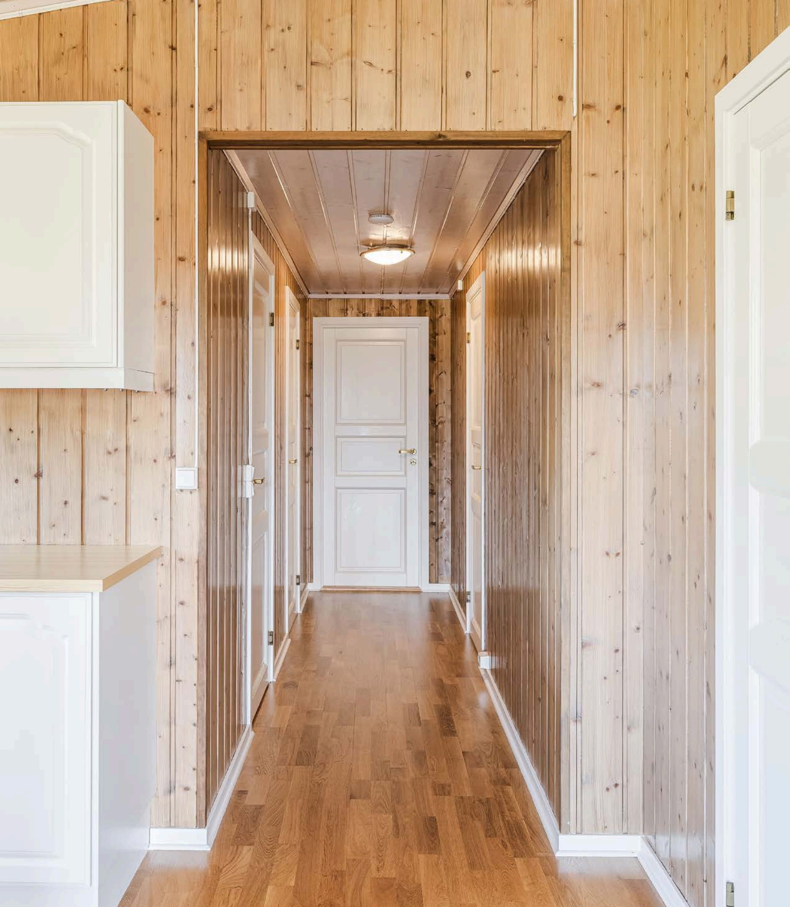
Gang med adgang til 3 soverom og baderommet.