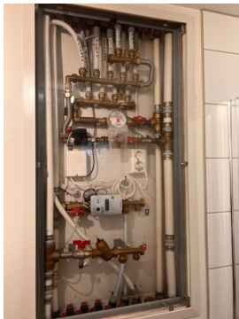
Fordelerskap for vannrør/vannvarme.

Leilighet i bygning er tilknyttet fjernvarme anlegg som forsyner leilighet med varmt forbruksvann og oppvarming.