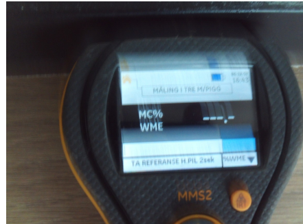
Under 8 vektprosent.