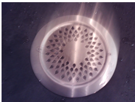
Sluk i dusjhjørne.

Synlig vinylbelegg med oppkant som tettesjikt og en sluk i dusjhjørne.