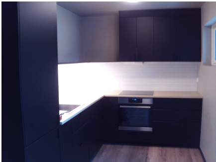
Deler av innredningen.

Laminatgulv, våtromsplater over kjøkkenbenken, malte slette vegger og himling. Innredning med slette fronter type sort.