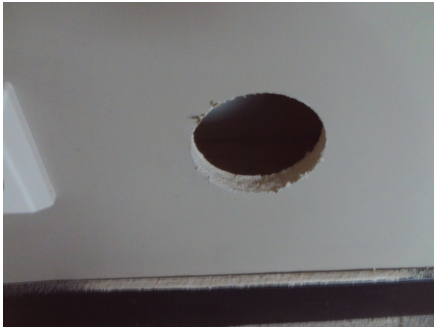
Hulltaking fra stue.