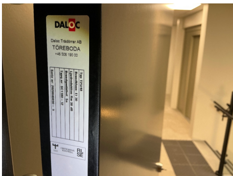
Brann og lydør mot felles gang

Inngangsdør av type EI30 brannør i henhold til krav. Balkongdører med trekarmen og isolerglass. Utvendig beslag på karmen. Balkongdører har generelt behov for justering. Heng i karmen.