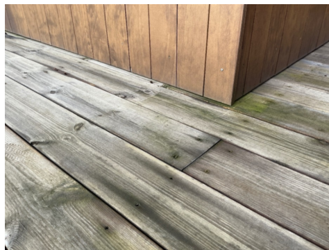
Stedvis lite klaring mellom terrassebord og kledning. Vanskelig tilgang for vedlikehold og øker slitasje i området.