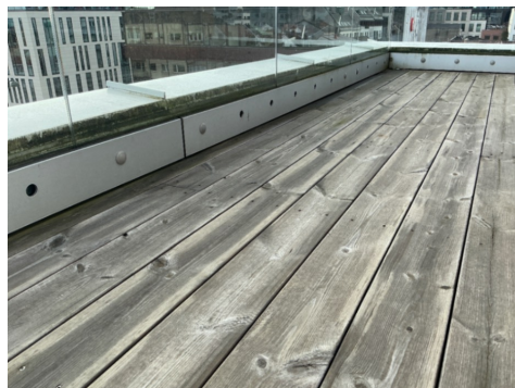
Det mangler «propper» flere steder på rekkverk.

Balkonger på tre sider av leiligheten. Terrassedekke av treverk og rekkverk av glass. Innfesting og høyde i henhold til krav. Vanlig vedlikehold må påregnes.