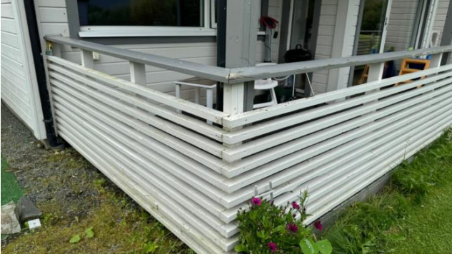
Bilde viser rekkverk og håndlist med behov for overflatebehandling.