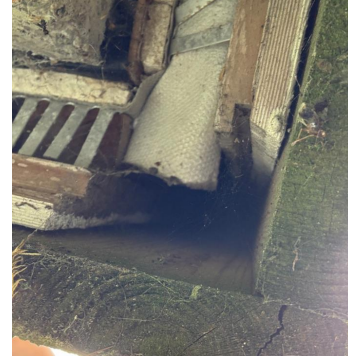
Bilde viser mangelfull tetting med musebånd på hushjørne.

Viser til vurderinger og eventuelle anbefalte tiltak som er nevnt over.