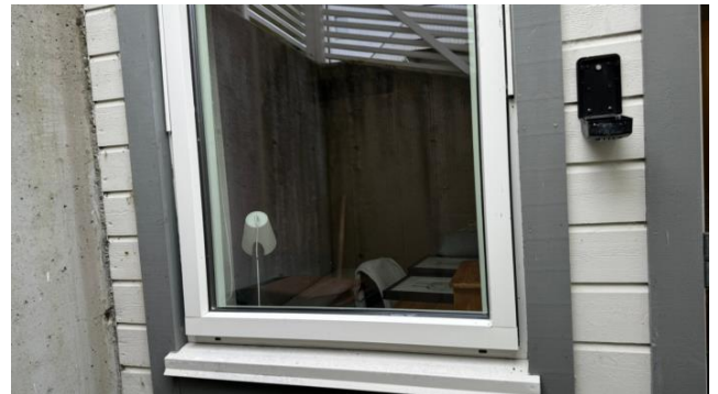
Bilde viser aluminiumsbeslått vindu med god tilstand.

Kommentar: Det ble utført en tilfeldig funksjonstest av enkelte vinduer og dører. Punktert vindu kan tidvis være vanskelig å avdekke grunnet vær og lys. Justering/normalt vedlikehold vurderes ikke som et vesentlig avvik.