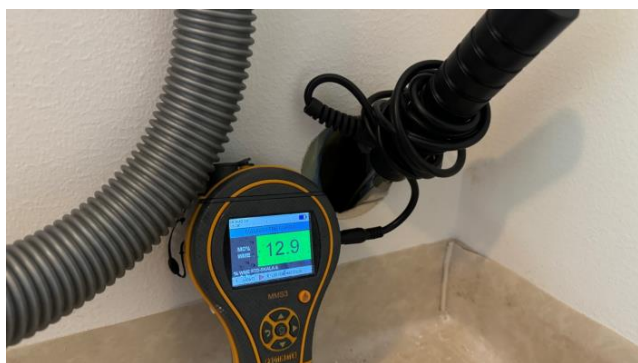
Bilde viser fuktmåling i vegg mot terreng.

Viser til vurderinger og eventuelle anbefalte tiltak som er nevnt over, samt eventuelle vurderinger under punktet "drenering".