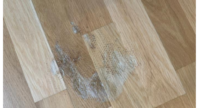
Bilde viser en av to skader på parkett i stue.

Viser til vurderinger og eventuelle anbefalte tiltak som er nevnt over.