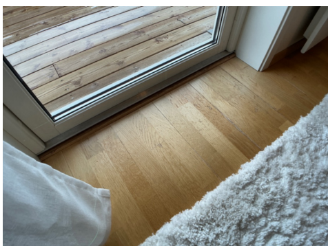
Noe slitasje på parkett ved terrassedør.

Innendig er det gulv av parkett. Veggene har malte plater. Innvendige tak har himlingsplater. Overflater ble visuelt kontrollert, uten å registrere synlige skader eller andre avvik utover normal bruksslitasje. Overflater er en skjønnsmessig vurdering og TG er vurdert utifra om det er skader/større slitasje på overflatene. Stedvis noe hakk og merker må forventes i en brukt bolig og kommenteres ikke hvis det ikke er utover det som er å betegne som normal bruksslitasje.