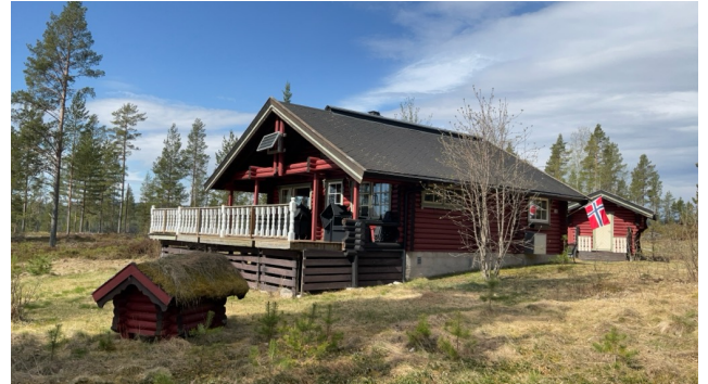
Solcellepanel i gavlspiss.

Det elektriske anlegget er ikke utdypende vurdert i denne rapporten da dette krever spesiell kompetanse og autorisasjon. På generelt grunnlag anbefales det derfor en gjennomgang av en el. fagmann. Heller ikke visuelle feil kommenteres hvis ikke dette fremgår særskilt.