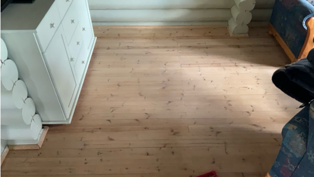
Normale krympesprekker i tregulv