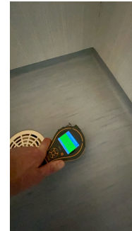
På gulv inne i dusjsone.