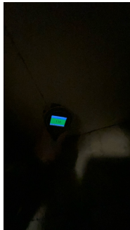
I vegg bak dusjsone.