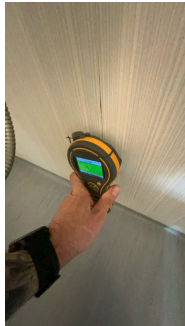
På vegg inne i dusjsone.

Det er en stor luke i veggen på boden som er rett bak dusjsonen. Fuktmålinger er fortatt der og inne i selve dusjen uten å påvise unormale forhold. Det er kun søkt med kapasitiv fuktmåler da det er brukt stålsviller. Plater som er tilgjengelige vil ikke gi riktige målinger ved piggmåling. Bakenforliggende plater har ingen synlige tegn til fuktpåkjennning sett fra luke på boden.