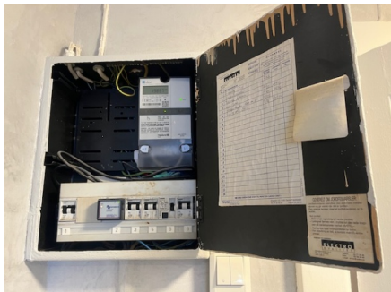
Sikringskap plassert i entre.

I følge DIBK (direktoratet for byggkvalitet) er det ikke den bygnings sakkyndige sitt ansvar å gjennomføre kontroll av det elektriske anlegget. Elektriske installasjoner er i dag strengt regulert med tekniske krav til installasjonene og kompetansekrav til de som skal utføre arbeidet. Det er bare fagfolk som har de nødvendige kvalifikasjonene etter forskrift om elektroforetak og kvalifikasjonskrav for arbeid knyttet til elektriske anlegg og elektrisk utstyr, som kan utføre el-kontroll.